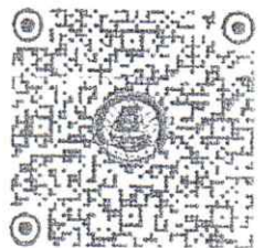
สิ่งที่ส่งมาด้วย ๑

สำนักงานจังหวัด กลุ่มงานบริหารทรัพยากรบุคคล โทรศัพท์/โทรสาร ๐-๗๓๖๔-๒๖๓๗