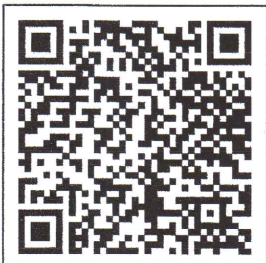
สแกน QR-Code รายละเอียดโครงการ

โทร. ๐๙ ๒๙๖๖ ๒๒๙๑ , ๐๙ ๑๕๖๖ ๙๙๕๒ , ๐๙ ๔๔๙๐ ๔๔๙๕