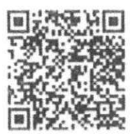
เอกสารที่เกี่ยวข้อง

กระทรวงมหาดไทย ๓๑ มกราคม ๒๕๖๗ (Signature)