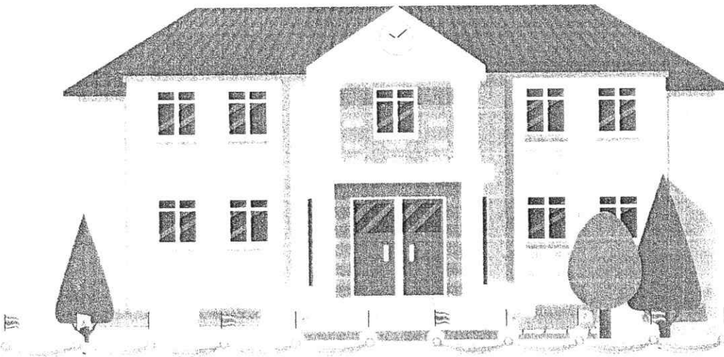
รัฐกำแพงสถานที่ราชการ

รัฐบาลขอเชิญหน่วยงานภาครัฐ ภาคเอกชน และประชาชน