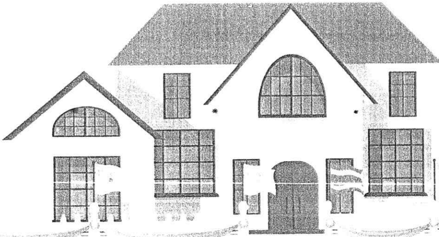
รัฐกำแพงอาคารของภาคเอกชน หรือนำบ้านเรือน