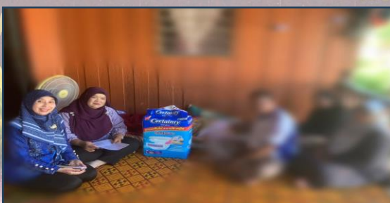
ชุมชนฮีเล