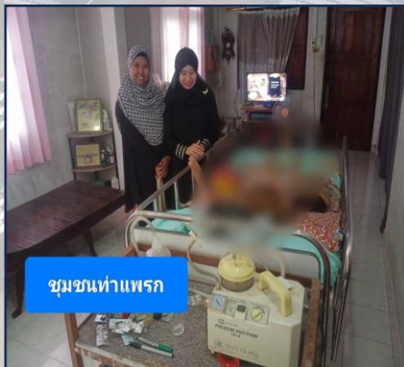
ชุมชนท่าแพนแก