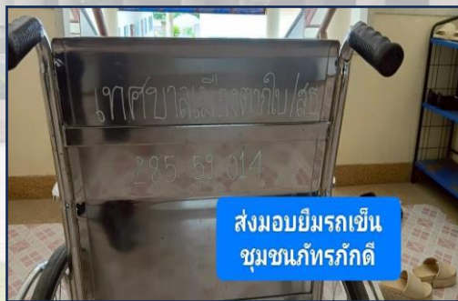
ส่งมอบยืมรถเข็น ชุมชนแก้วทรวงศ์ดี