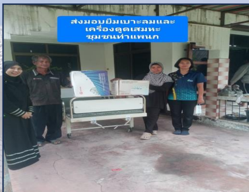
ส่งมอบยืมเบาะลมและ เครื่องดูดเสมหะ ชุมชนท่าแพนแก

ลงพื้นที่เยี่ยมเยียนดูแลผู้สูงอายุที่มีปัญหาด้านสุขภาพร่วมกับ เจ้าหน้าที่โรงพยาบาลตากใบ