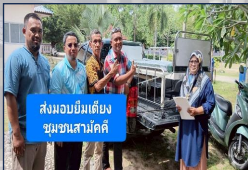
ส่งมอบยืมเตียง ชุมชนสามัคคี