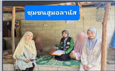
ชุมชนฮุมอลานัส