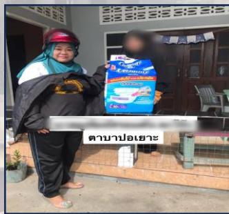
ตาบ่าปอเฮาะ