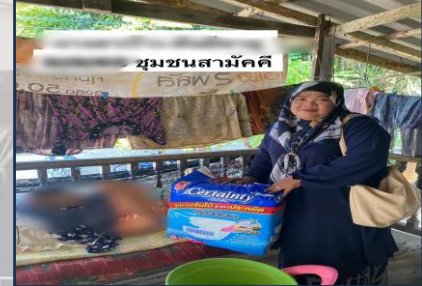
ชุมชนสามัคคี