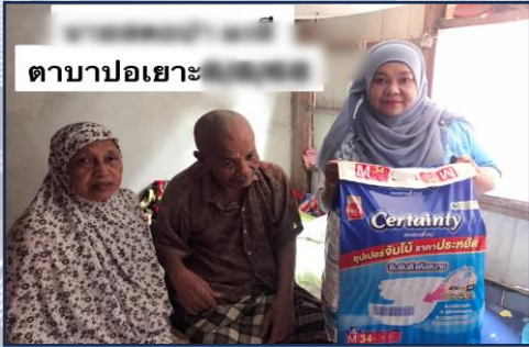
ตาบ่าปอเฮาะ