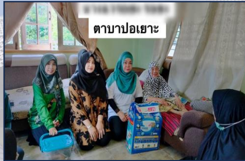
ตาบ่าปอเฮาะ