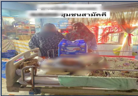
ชุมชนสามัคคี