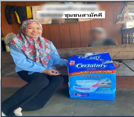
ชุมชนสามัคคี