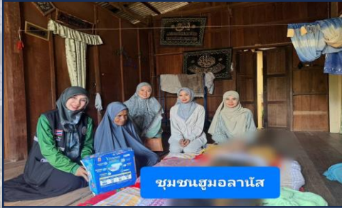
ชุมชนฮุมอลานัส