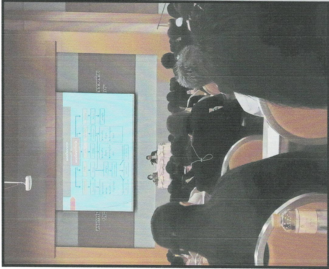
การส่งบุคลากรเข้ารับการอบรมตามสายงานที่ปฏิบัติหน้าที่