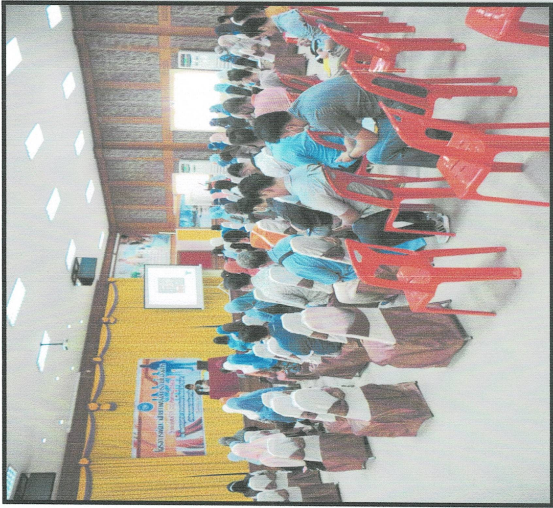
การจัดโครงการพัฒนาศักยภาพบุคลากร เพื่อให้ความรู้แก่บุคลากรในการปฏิบัติงาน และเสริมสร้างคุณธรรม จริยธรรมให้กับบุคลากร