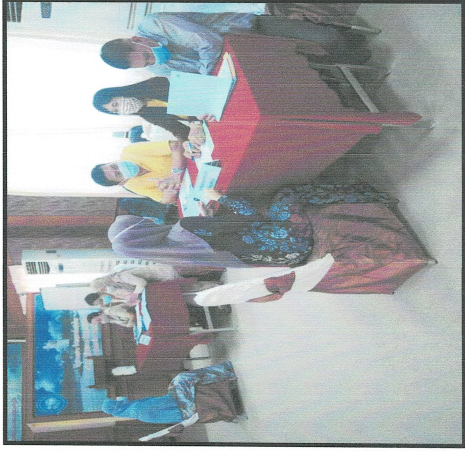
การสอบคัดเลือกบุคคลเป็นพนักงานจ้าง