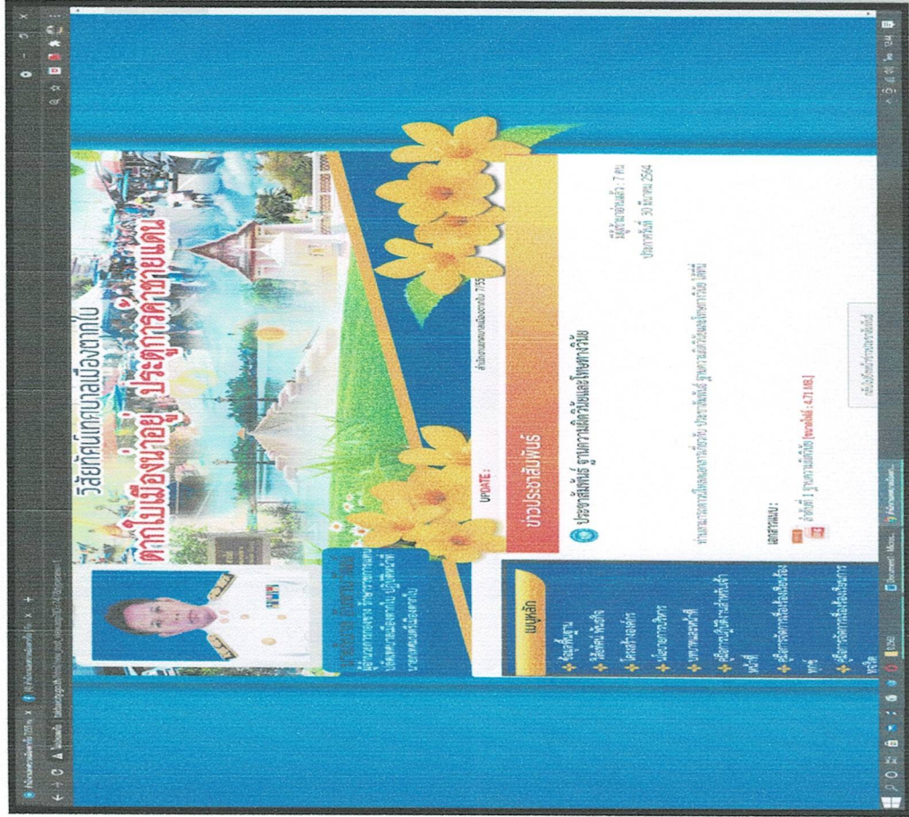
ประชาสัมพันธ์ความรู้อาชีวศึกษา ผ่านเว็บไซต์เทศบาลเมืองตากใบ