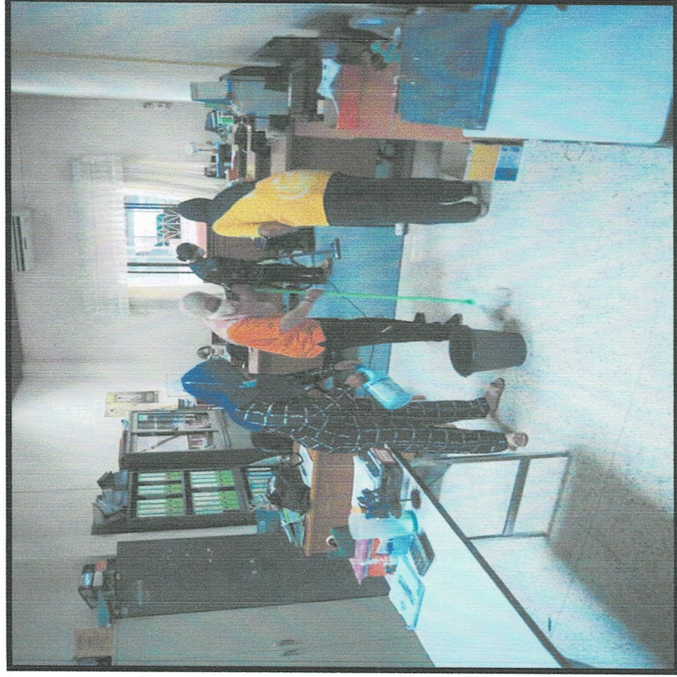
การจัดทำความสะอาด(Big Cleaning Day) อาคารสำนักงานเทศบาลเมืองตากใบ