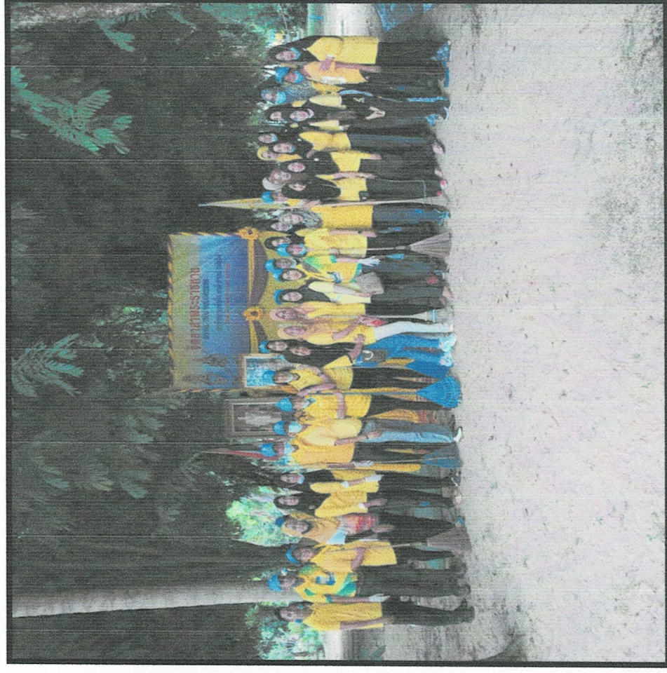
จัดทำกิจกรรมบำเพ็ญประโยชน์สาธารณะ